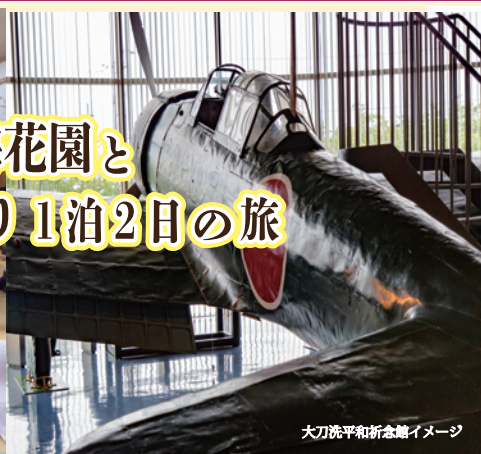
大刀洗平和祈念館イメージ