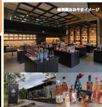
梅酒蔵おおやまイメージ